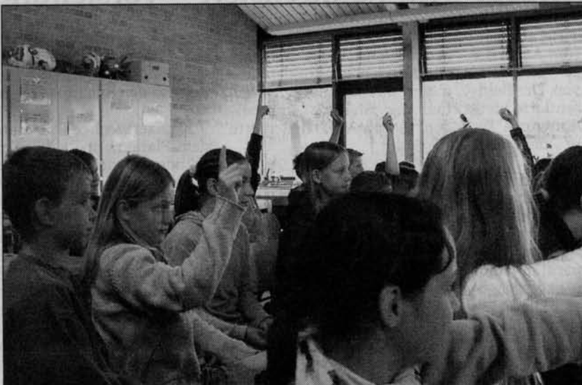
Nach anfänglicher Zurückhaltung sprudelten die Fragen der Schüler aus der 4e richtig heraus – keine Spur mehr von Berührungsängsten.

Dass er einen guten, verbindenden Weg gefunden hat, zeigt sich, als eine Schülerin zum Schluss bemerkt: „Rollstuhlfahrer sind eigentlich genauso wie wir, nur dass sie halt behindert sind.“